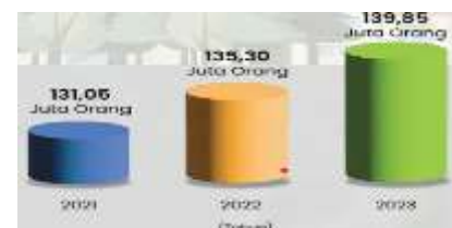
Grafik 1. Angkatan Kerja di Indonesia Tahun 2021-2023