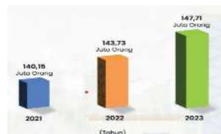
Grafik 2. Jumlah Penduduk Bekerja Tahun 2021-2023

Angkatan kerja di Indonesia mengalami peningkatan sebesar 5.39 persen selama tahun 2021 sampai 2023. Hal ini mengindikasikan bahwa semakin bertambahnya ketersediaan pasokan tenaga kerja di Indonesia.